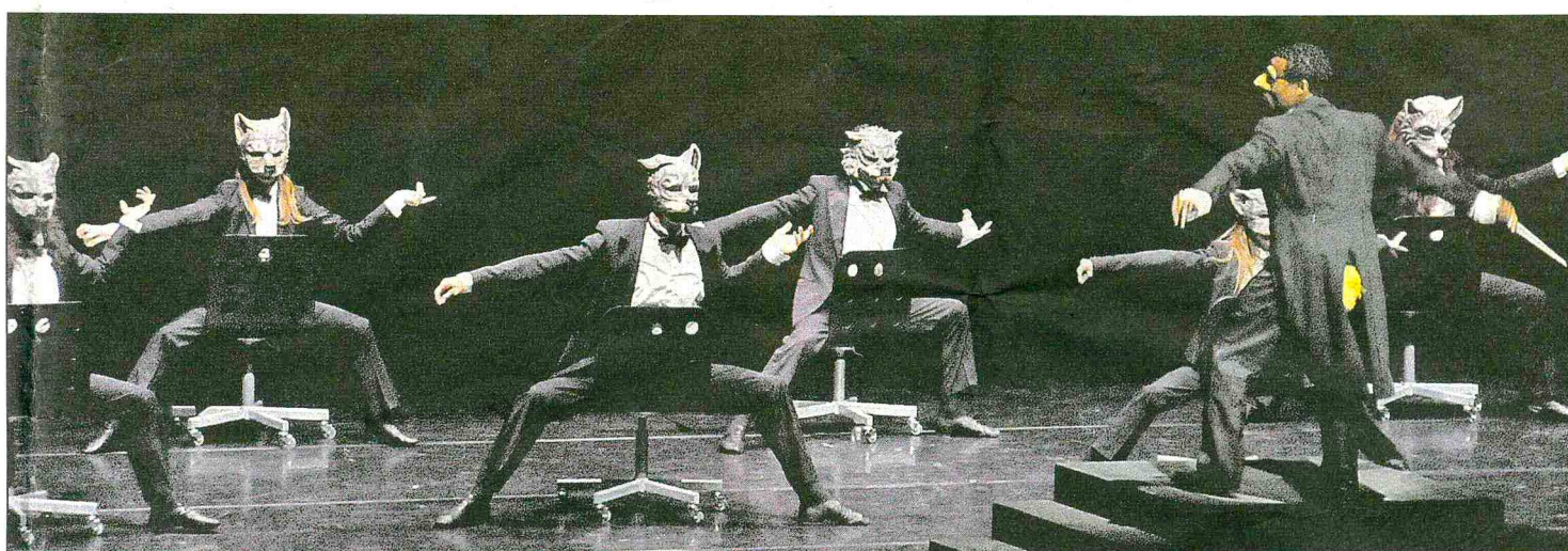
Die Eric Gauthier Dance Company spannt beim Innsbrucker Tanzsommer gekonnt den Bogen vom klassischen Ballett zur Avantgarde

Riesenerfolg für Eric Gauthier Dance Company beim Innsbrucker Tanzsommer