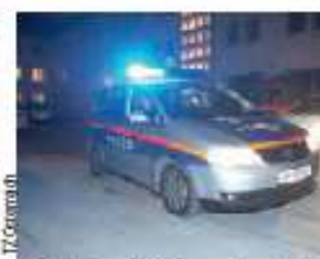
Polizei konnte Täter ausforschen.

Taxler rettete Mann. Dabei zog sich das Opfer mehrere